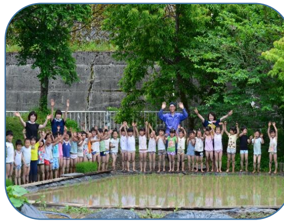
おいしいお米にな~れ! 年長さんが田植えをしてくれました。