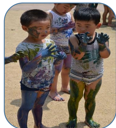
ポティーペインティング