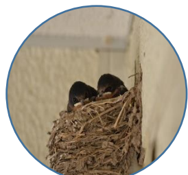
ツバメの赤ちゃんが 生まれました!

社会福祉法人石浦龍華会 こま草保育園 高山市丹生川町町方 1470 - 2 Tel 0577-78-1211 平成 30 年 7 月 1 日 発行 うさぎバス 090-7678-6426 りすバス 080-2657-4389