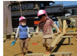
ゆう道が面白い さくらんぼみ、ゆう