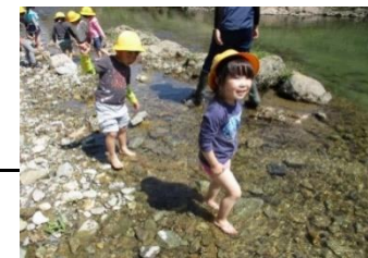
年中、かわあそび きもちよさそう～