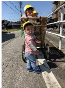
もも1、お散歩 たのしいね

園生活も1ヶ月が過ぎようとしています。子供たちも新しい生活に少しずつ慣れてきました。大きい子たちは、体中泥んこになって遊んだり、木材で長い橋を作ったり、木登りしたり、園外で川にぎぶざぶ入ったりとダイナミックに遊んでいます。小さい子たちも可愛い笑顔で遊ぶ姿が増えてきました。これから外遊びに最適な季節！楽しい遊びを沢山探して行って欲しいと思っています。