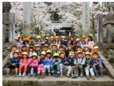
年少、初めてのお出かけ バスに乗って、出発！