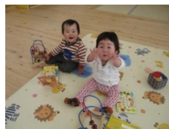
もも0、おともだちになったよ

未就園のお子さんをお持ちの保護者の方へ... お子さんの誕生月に、1週間前までにご予約いただければ、毎月の誕生会で一緒に祝いができます。